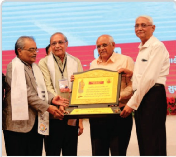
માનનીય મુખ્યમંત્રીશ્રીનું સન્માન કરતાં સંસ્થાના ટ્રસ્ટીશ્રીઓ