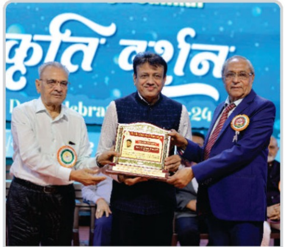
સુરત શહેરના મેયરશ્રીનું સન્માન કરતાં સંસ્થાના ટ્રસ્ટીશ્રીઓ